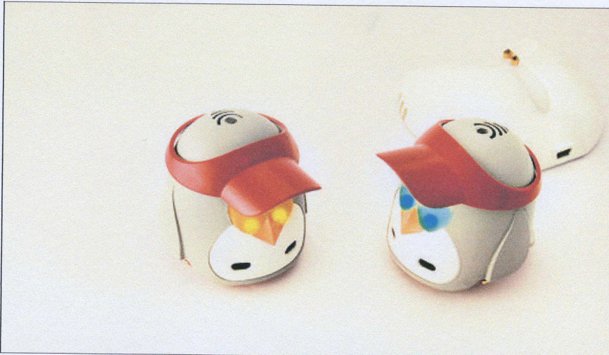
Le pingouin MyDeskFriend. L'animal de compagnie, capable d'exprimer ses émotions par la couleur de ses yeux, sera commercialisé cet été.